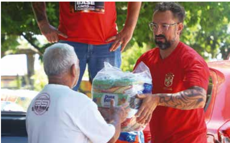
Sindicato levou as cestas básicas para as famílias da comunidade Cerâmica, já cadastradas e entregou depois de conferir na listagem