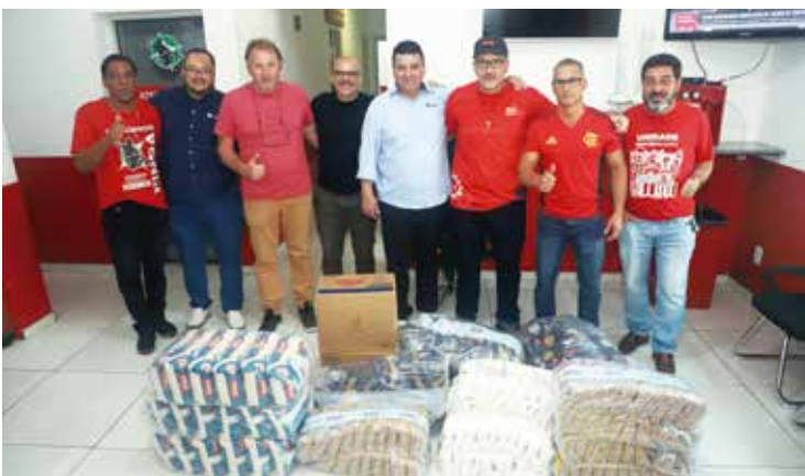
Doação da fábrica Gerdau, uma das várias fábricas que ajudaram na campanha