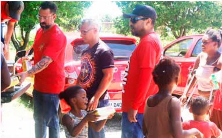
Sindicato também entregou uma caixa de bombom para cada criança no Cerâmica