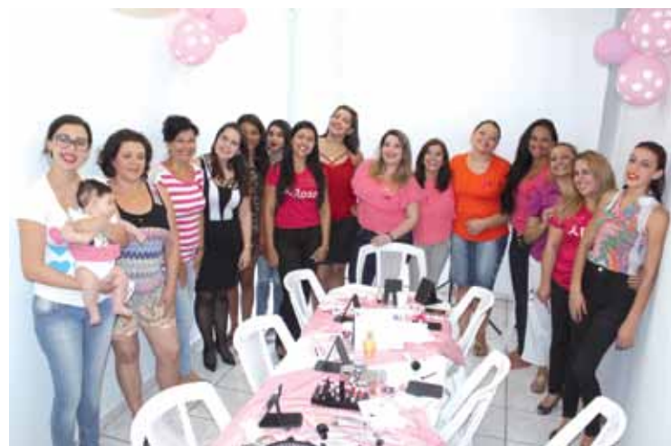
Evento realizado na subsede de Moreira César, no dia 27 de outubro