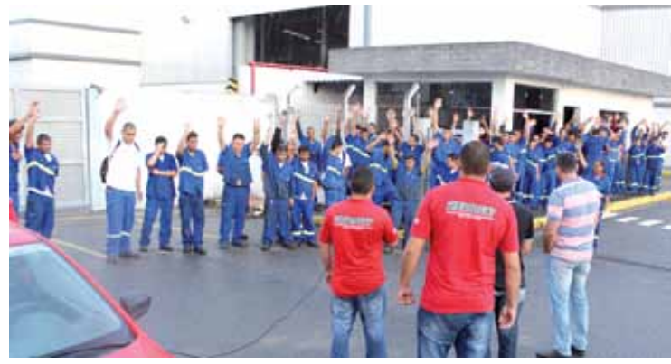
Na mesa de negociação, a direção da Elfer aceitou pagar o total da inflação, que foi aplicado na folha de pagamento de novembro