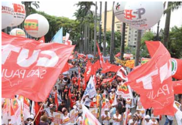
Ato que reuniu milhares em São Paulo, na Praça da Sé, contra medidas do governo Temer

Ao lado de centrais sindicais em defesa da classe trabalhadora e de organizações dos movimentos sociais, a CUT convocou um Dia Nacional de Greve e a população respondeu com centenas de manifestações em todo país.