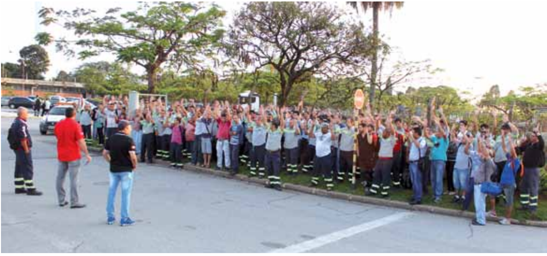
Trabalhadores da Confab aprovam em assembleia proposta de reajuste conquistada nas negociações junto às bancadas patronais, na Fiesp

Em duas fábricas, na Harsco e na Incomisa, os funcionários entraram em greve para conseguir o reajuste da inflação e uma terceira esteve prestes a entrar em greve por salário - a Bundy.