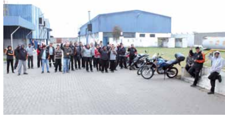
Após essa assembleia de redução de jornada em julho, a Oversound recuperou produção, terminou antes o work-sharing e agora também vai aplicar o reajuste