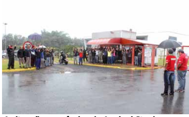
A situação econômica da Appiani Steel (Martifer) continua complicada e ainda assim ela irá pagar o reajuste aos trabalhadores