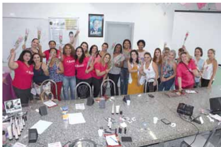
Evento realizado na sede do sindicato no dia 20 de outubro