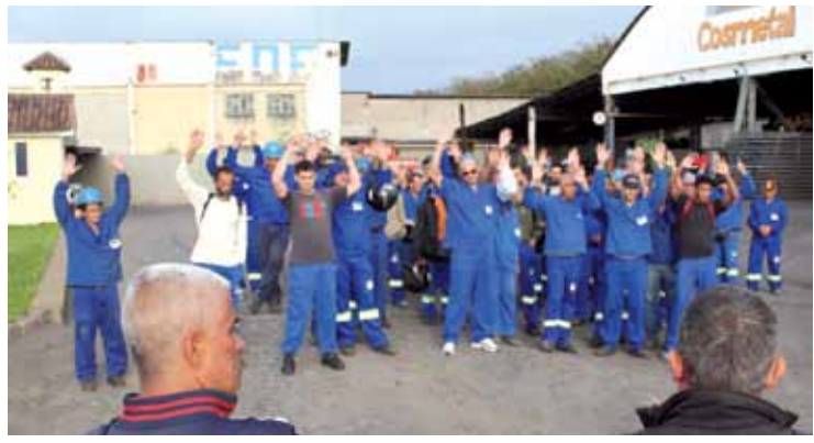
Os trabalhadores da Cosmetal receberão o reajuste total da inflação no dia 30/11, também retroativo à data-base