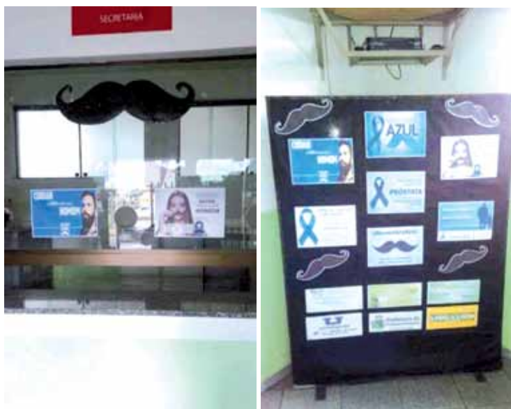
Interior do sindicato também foi decorado com mensagens do Novembro Azul

do o atendimento para fazer esses exames e também o encaminhamento a partir do resultado.