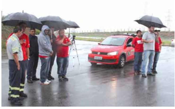
Mesmo nos dias de chuva, nem sindicato nem trabalhadores deixaram de fazer as mobilizações e brigar por seus direitos