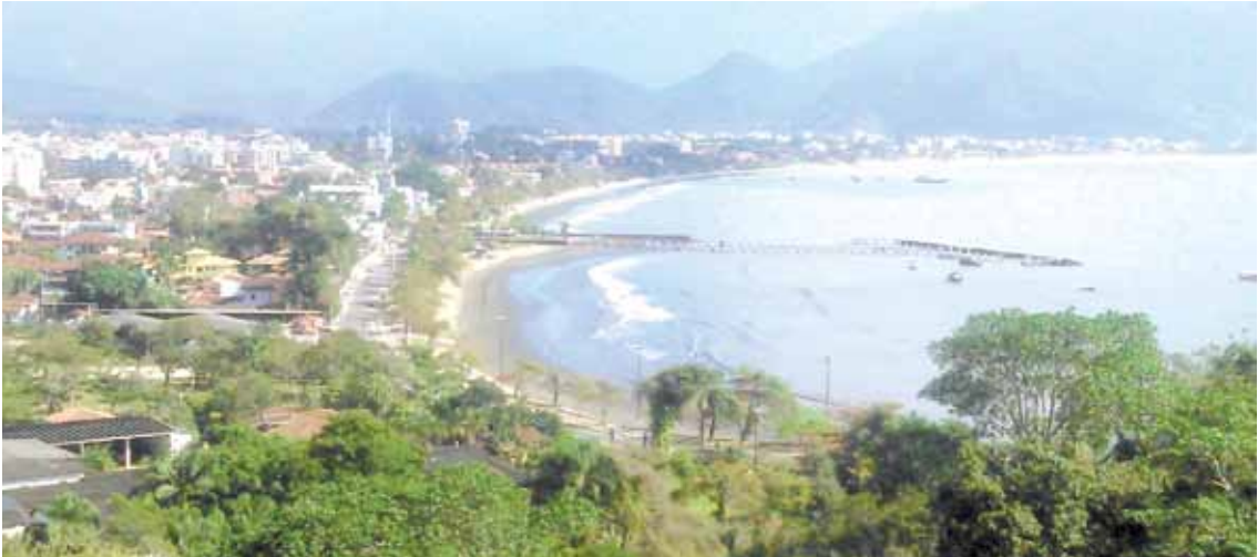
Vista da praia do Itaguá da sacada da colônia de férias do sindicato; sorteio será para estadia de 5 dias durante o feriadão de Carnaval

As inscrições para sorteio da Colônia de Férias do sindicato em Ubatuba para o período de carnaval serão feitas entre os dias 25 e 28 de janeiro. Na sexta, dia 29, às 17h, será realizado o sorteio na sede do sindicato, bem