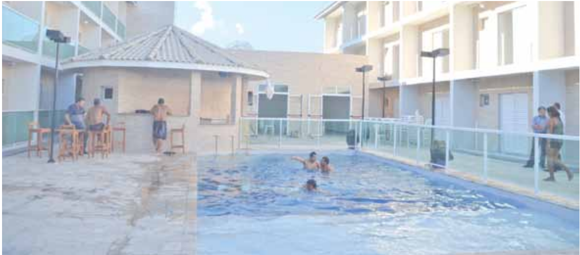
Piscina grande com espaço raso para crianças e quiosque; colônia fica em Itanhaém, na Baixada Santista, a poucos metros da praia do Suarão

Os metalúrgicos de Pin-da têm mais uma opção para viajar com a família, a Colônia de Férias da FEM-CUT/SP (Federação dos Sindicatos Metalúrgicos da CUT no Estado de São Paulo), em Itanhaém, no litoral sul paulista, que pode ser vista da areia da praia. A colônia conta com infraestrutura sofisticada, com piscina, auditório e 98 apartamentos em uma área de três mil metros quadrados.