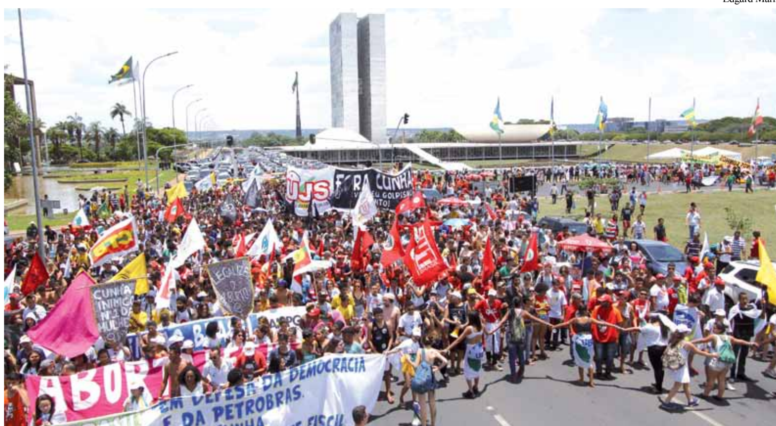
Ato nacional em defesa da democracia, da Petrobrás, contra o ajuste fiscal e contra o golpismo, realizado em novembro em Brasília e em todo o país

Mas, como diz no jargão no futebol, quem não faz, toma. Com apoio das ruas, é hora do governo sair da defesa e partir para o ataque.