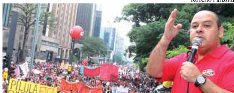
O presidente nacional da CUT, Vagner Freitas, durante mais um protesto na Av. Paulista

Na opinião de Vagner, um primeiro passo foi dado, com a saída do ex-ministro da Fazenda, Joaquim Levy - que representava a política de benção ao mercado financeiro, estagnando a economia em nome do ajuste fiscal -, mas o novo caminho precisa se concretizar com