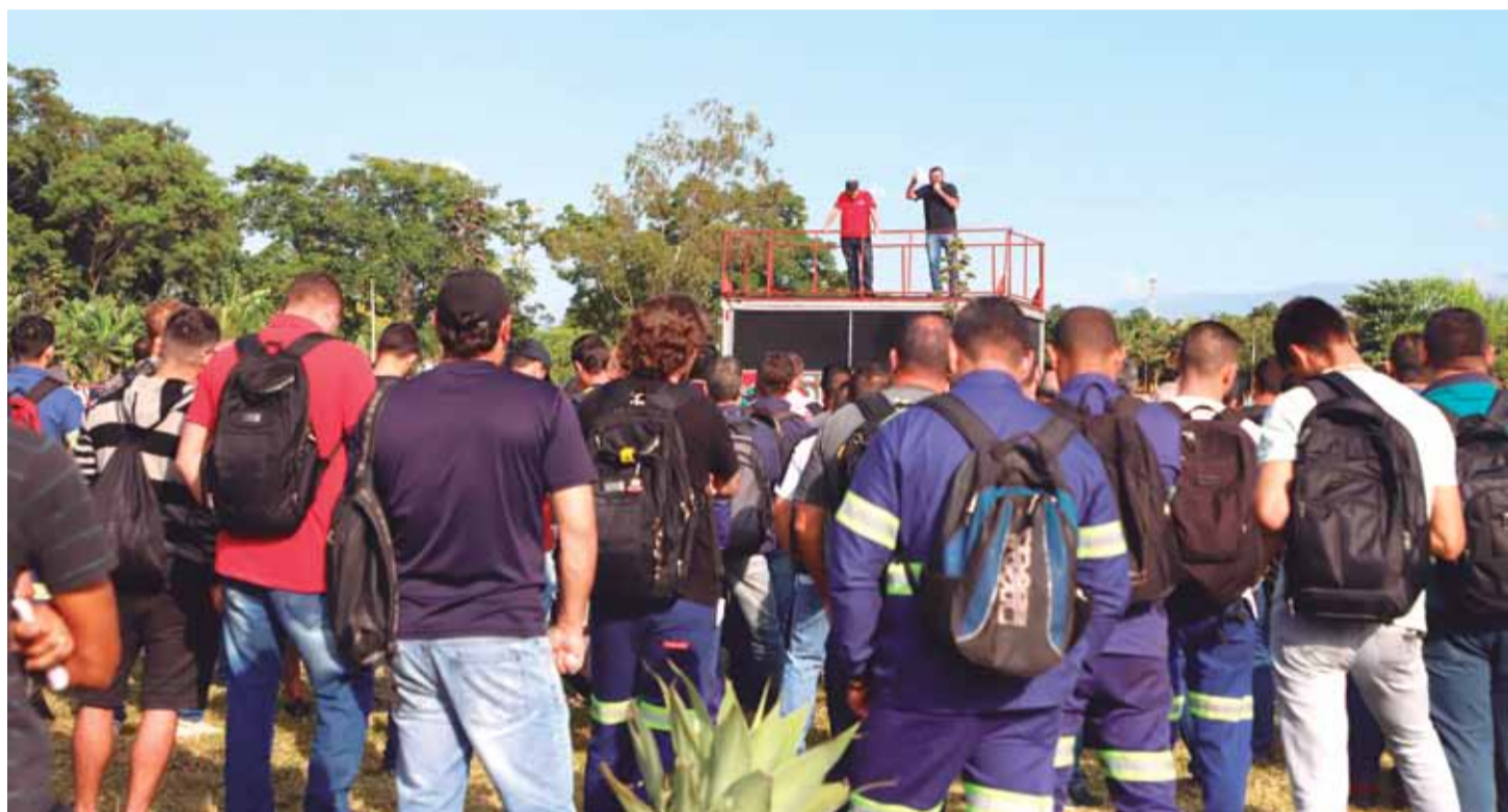
Paralisação na Gerdau no último dia 12, com adesão total; esse foi o segundo protesto na fábrica só neste ano por causa de problemas na PLR, o chamado "Programa Metas"

O ato teve adesão total e mostrou para a empresa a unidade da categoria. Novas paralisações podem ocorrer.