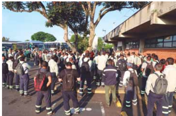
Paralisação em fevereiro criticou falta de proporcionalidade na comissão