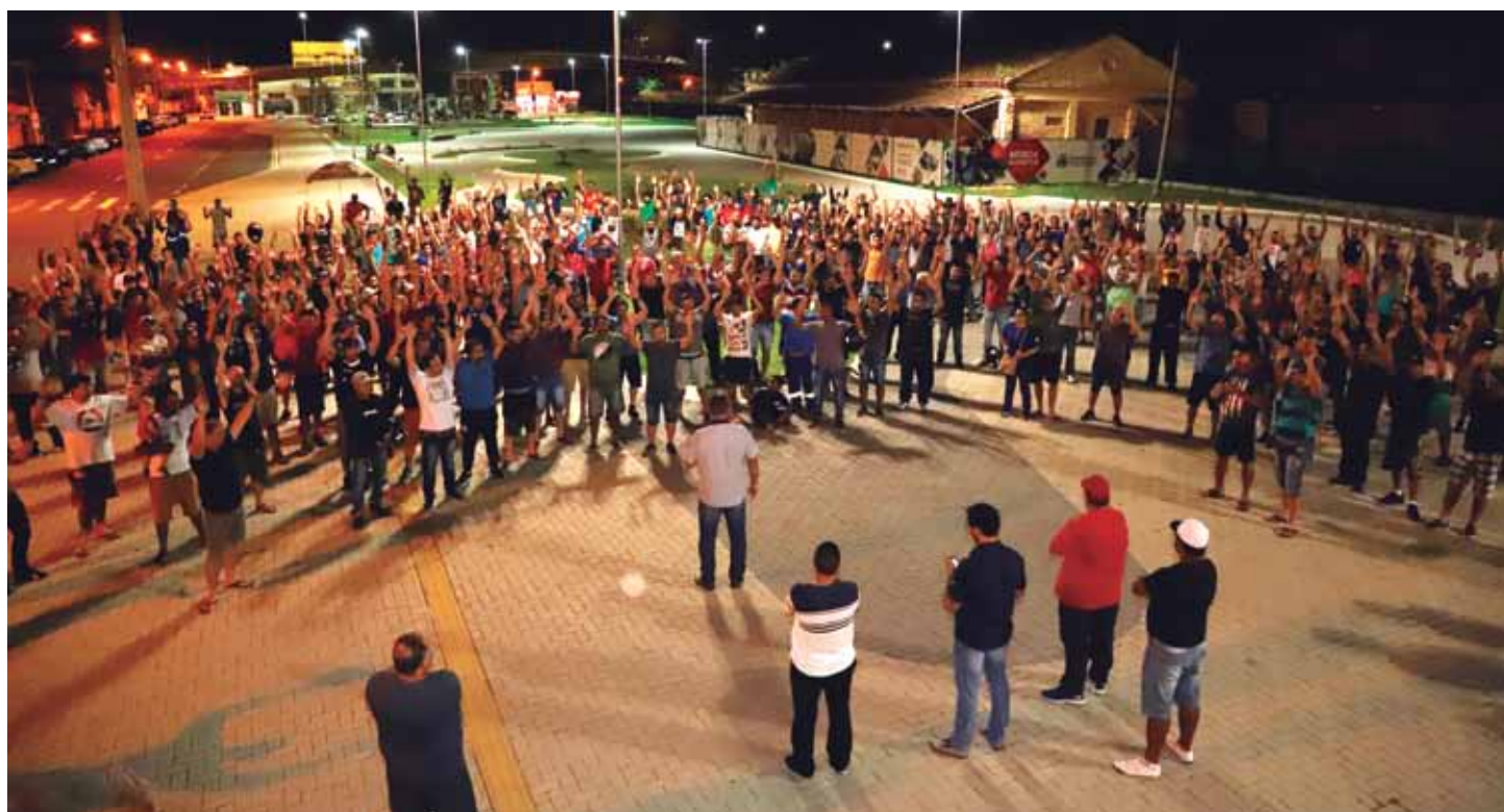
Assembleia na praça Sete de Setembro aprovou por unanimidade proposta que está beneficiando mais de 1.000 pessoas e ajudando a economia do município

Com o acordo firmado, o sindicato evitou uma batalha jurídica que levaria muitos anos para ser definida e ainda está contribuindo com a economia da cidade.