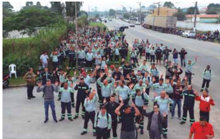
Situação ainda é de alerta, mas greve deu fôlego e abriu caminho de negociação