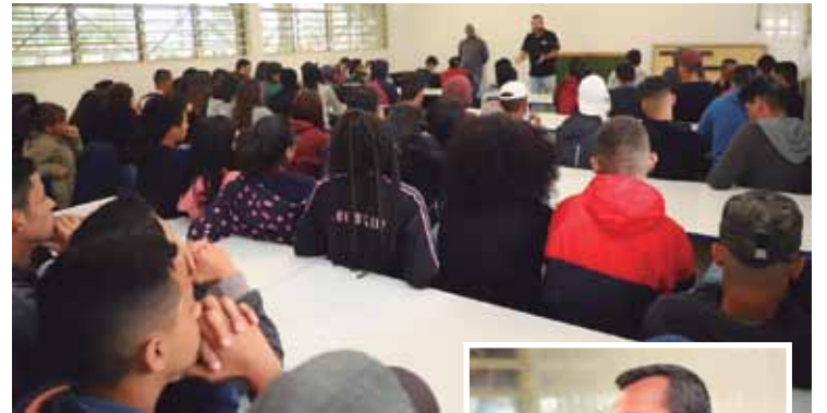
Vela fala aos alunos do 3º ano do ensino médio na EE Rubens Zamith