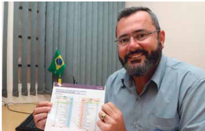
Pesquisa Seade mostra que Pinda lidera segmento e confirma perfil da cidade