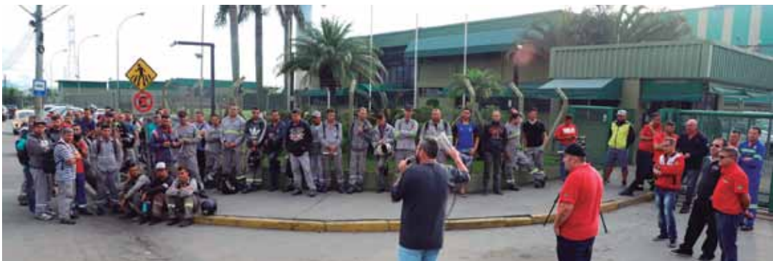
Paralisação teve adesão total, inclusive dos funcionários da Jorge Caldeiraria; sindicato está discutindo PLR com a empresa

Os trabalhadores da Latasa fizeram uma paralisação, com adesão total, contra a Reforma da Previdência no mês de abril.