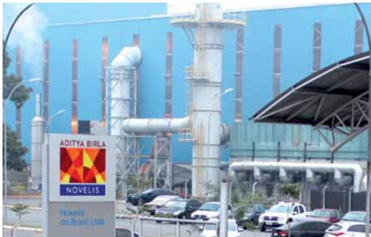
Depois da construção, medida vai gerar 50 empregos diretos na fábrica

A Novelis anunciou um novo pacote de investimentos para Pindamonhangaba, de R$ 650 milhões para ampliar a capacidade de produção de chapas e de reciclagem de sucata de alumínio.