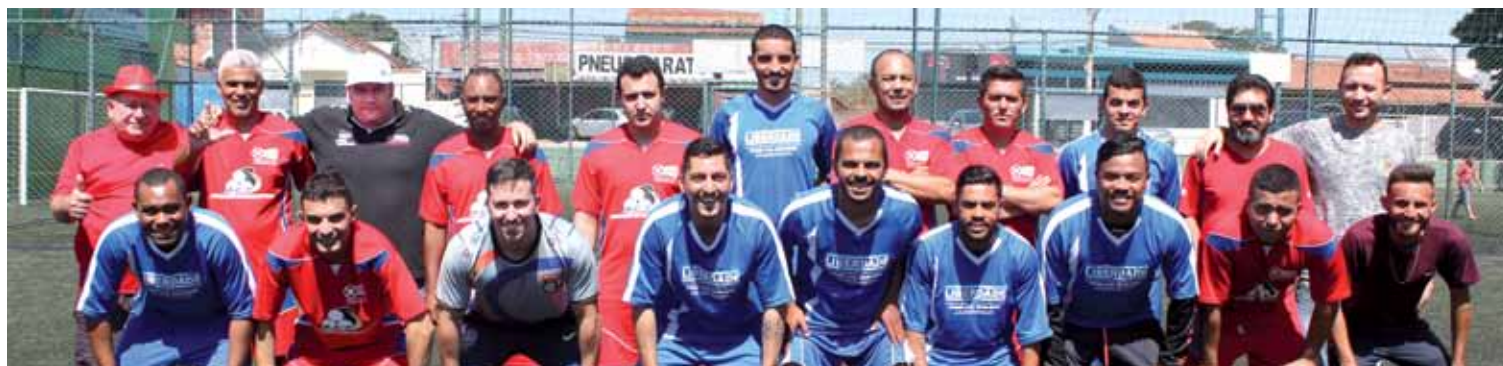
Final ocorreu entre Coating e Confab