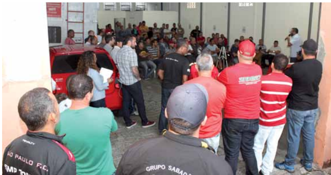
Assembleia geral que aprovou proposta da Campanha Salarial contou com um dos maiores índices de participação dos trabalhadores