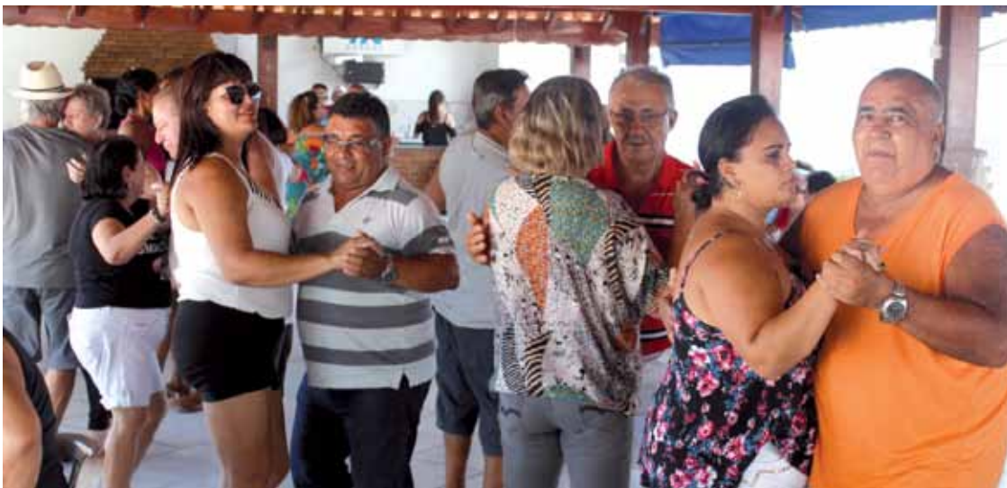
Festa será no Clube da Sabesp; exclusiva para sócios do CSA

No dia 16 dezembro, domingo, será realizada a 6ª edição da festa dos aposentados metalúrgicos de Pindamonhangaba.