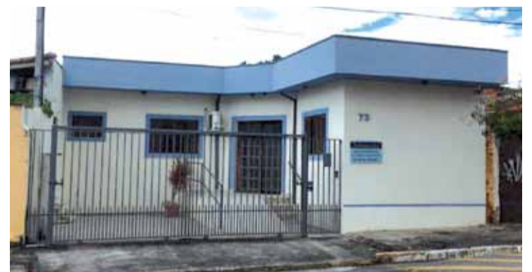
Fachada do escritório; atendimento em Moreira César continua às quartas-feiras

O Departamento Jurídico do sindicato também está em novo endereço: