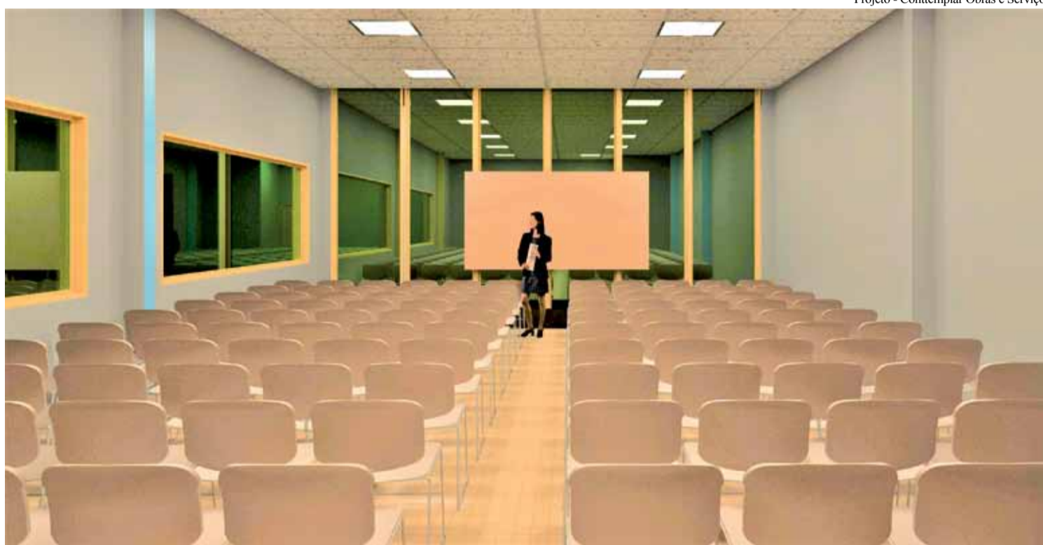
Projeto - Contemplar Obras e Serviços

Tudo para melhor o serviço para os sócios do sindicato. Estamos preparando uma nova Casa do Trabalhador.