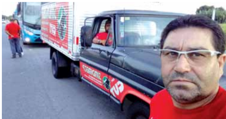
Dirigentes Lagoinha e Valdir apoiaram mobilização dos companheiros condutores

Depois que os funcionários da Gerdau entraram, a paralisação dos motoristas continuou até que a Clarear viesse conversar com o