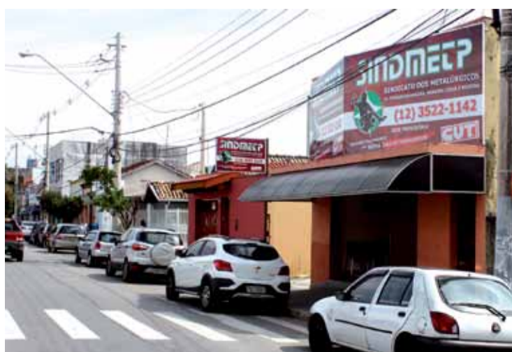
Novo local fica em frente ao PAT, na mesma calçada do salão de cabeleireiro do sindicato

O atendimento médico está sendo feito na subsele Moreira César, mas a distribuição de senhas continua sendo feito na sede.