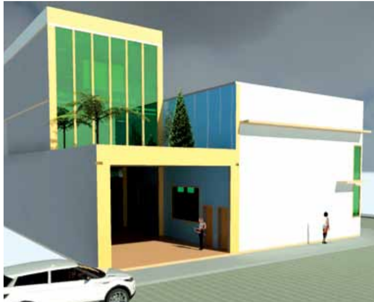
Projeto da nova sede do sindicato, com mais dois andares acima da garagem

do sindicato Herivelto Vela, a obra é necessária para dar condições adequadas aos sócios. "Também vai permitir a realização de muitos encontros para de-