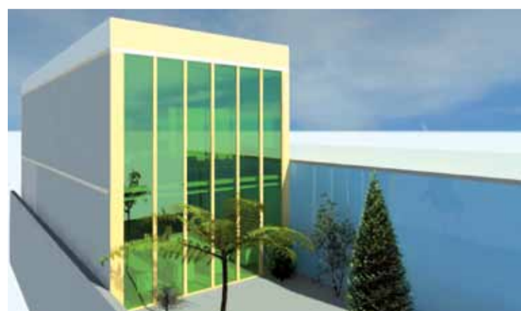
Estrutura acima da garagem; sede funcionará em outro endereço nos próximos meses