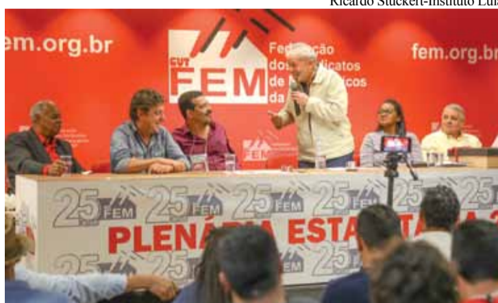
Evento contou com presença de Lula e empossou novos membros