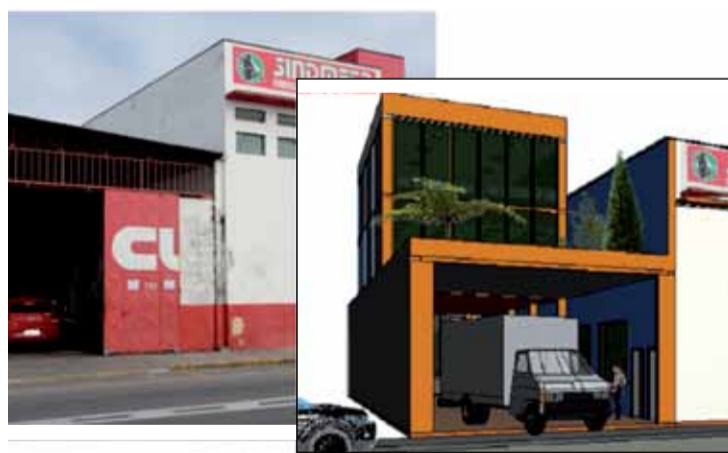
Imagem atual e projeto da nova sede, com mais 400 m 2 em dois pavimentos

O projeto também inclui a instalação de um elevador, para melhorar a acessibilidade do local.