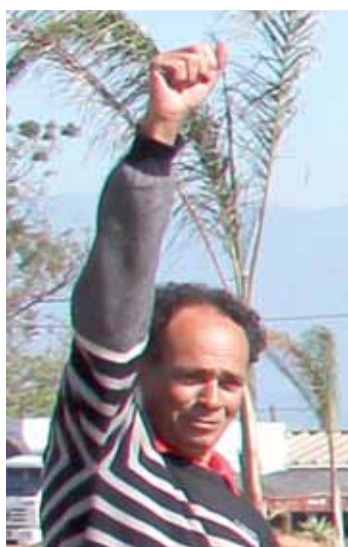
Greve pela Campanha Salarial na Gerdau no dia 8/10/14