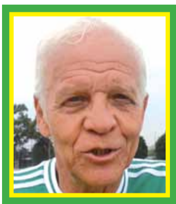
Ademir da Guia Palmeiras

Veja os craques que já confirmaram presença.