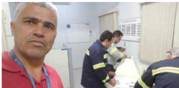
Direção do sindicato na apuração dos votos

Os trabalhadores da Tenaris Coating elegeram no dia 13 de junho os novos membros da Cipa (Comissão Interna de Prevenção de Acidentes).