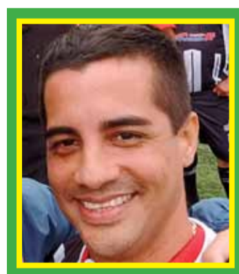
Pavão São Paulo

O volante Ezequiel Ataliba foi campeão Brasileiro pelo Corinthians em 1990, também pela Supercopa, Copa do Brasil, Campeonato Paulista. Também foi campeão paulista pelo Ituano. Começou na base do Ponte Preta.