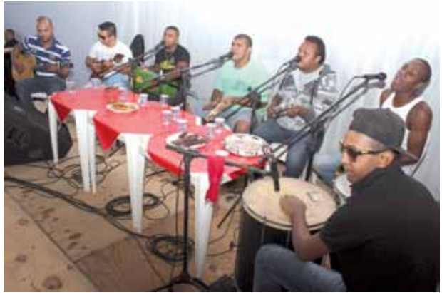
Com show de pagode e também de sertanejo, muitos ficaram o dia todo no evento do sindicato no Sítio 4 Milhas