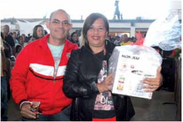
Vários prêmios também foram sorteados por cupom, só para quem estava presente