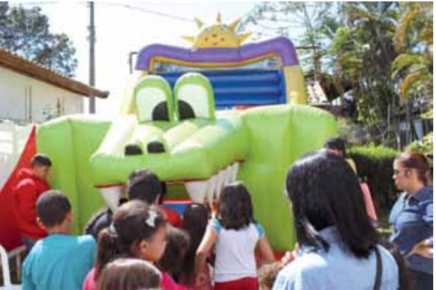
Brinquedos infláveis, cama elástica e a piscina de bolinhas garantiram a festa da criança