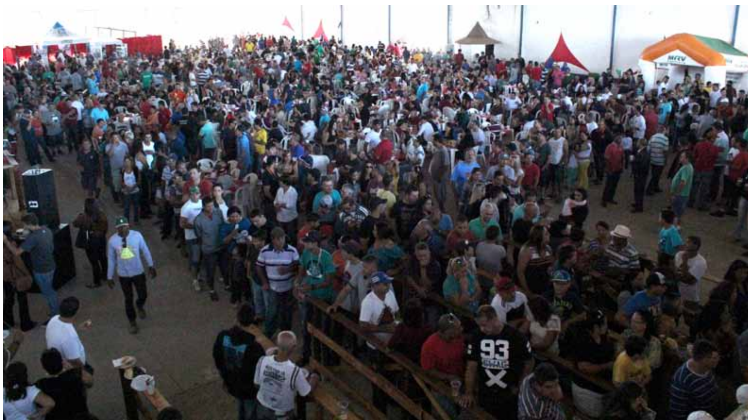
Evento lotou o Sítio 4 Milhas por todo o dia, com show de pagode, sertanejo e sorteio de prêmios

Durante o dia, a direção do sindicato também falou sobre a importância da democracia e sobre o cenário político nacional.