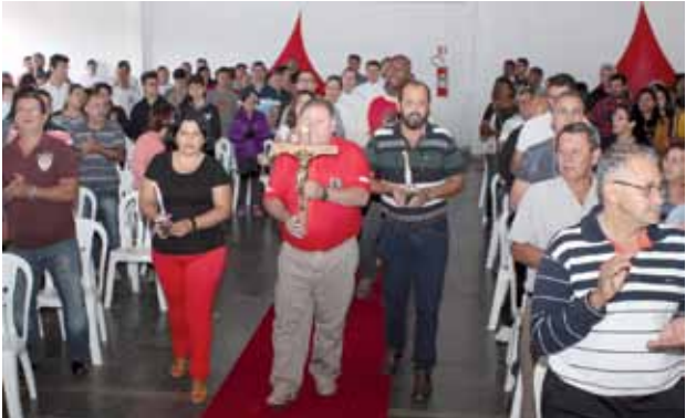
Dirigentes sindicais também participaram da procissão de entrada e das leituras na missa