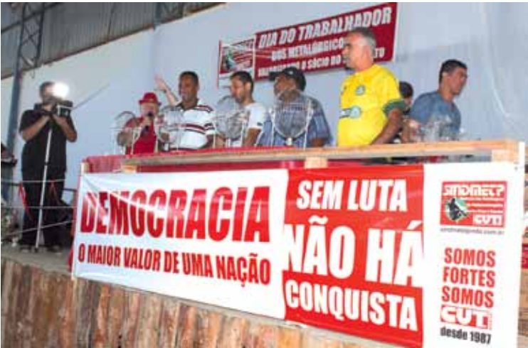
Direção falou sobre a importância da democracia e fez uma análise do cenário político nacional do ponto de vista sindical