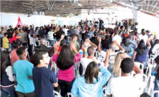
Pela 1ª vez, o sindicato organizou a Missa do Trabalhador, pelo Dia de São José Operário; o salão ficou lotado